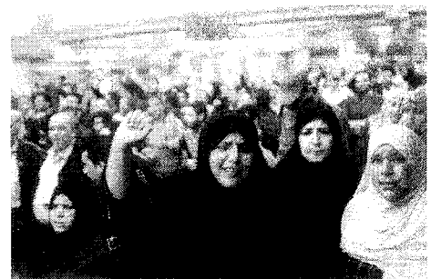
Protestierende in Ägypten

Die überwältigende Reaktion auf diese Eilaktion hat erheblichen Druck auf die ägyptischen Behörden ausgeübt, die AktivistInnen freizulassen, und hat nach Einschätzung von Amnesty International zum positiven Ausgang der Situation beigetragen. (UA-020/2011)